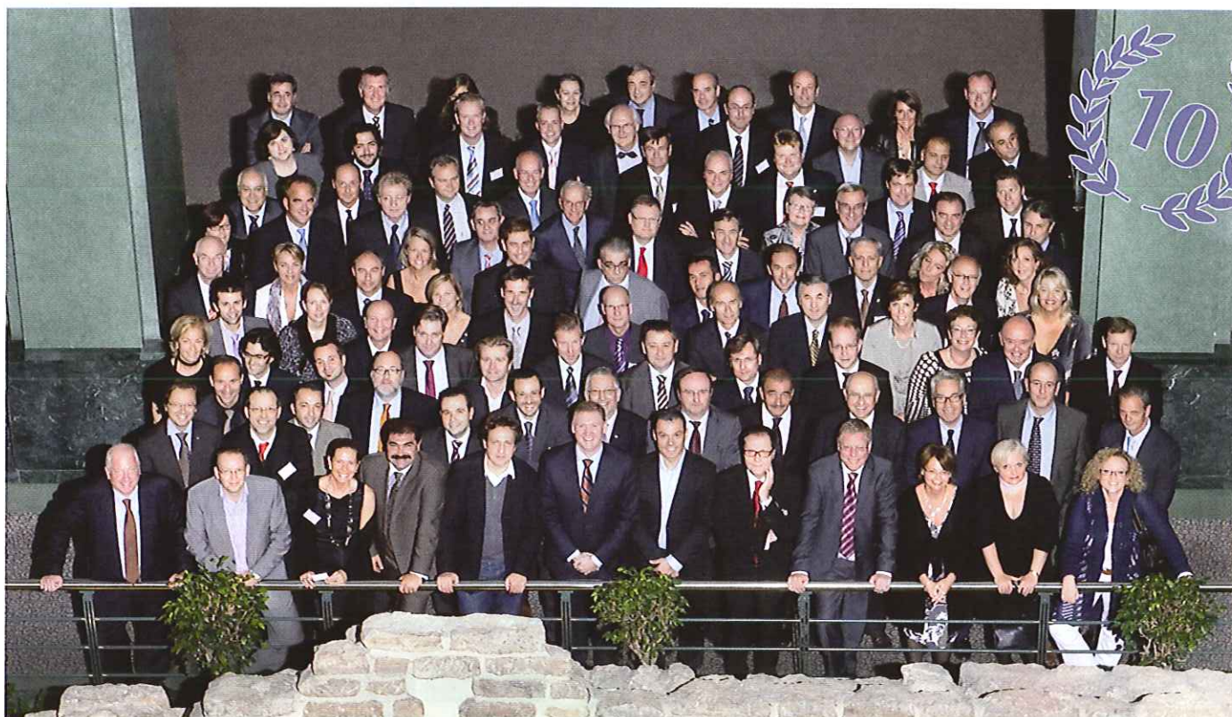
La 10 e assemblée générale de l'EBIA s'est tenue en octobre dernier à Bruxelles.

Comme chaque année, l'Ebia, European Bedding Industries' Association (l'association européenne des industries de la literie), a rassemblé ses adhérents durant deux jours de conférence. Au cœur de Bruxelles, ils ont ainsi pu échanger et discuter des évolutions de l'industrie de la literie dans une ambiance conviviale.